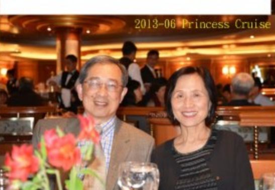
2013-06 Princess Cruise