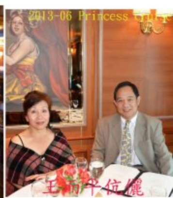
2013-06 Princess Cruise