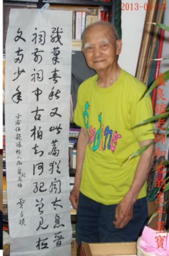
于右任題孫瑜人西晉馬橋 聖古頌