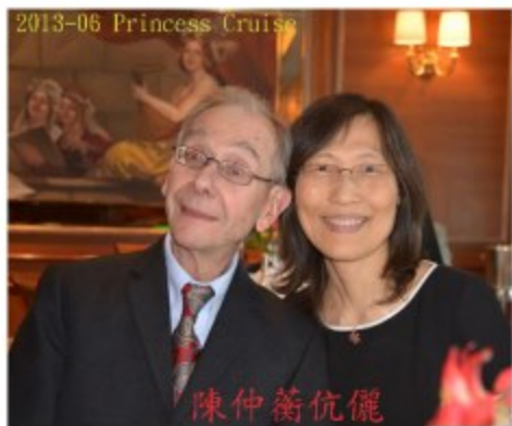
2013-06 Princess Cruise