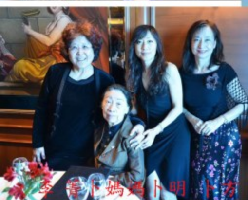
李 菁 卜媽媽 卜明 卜李