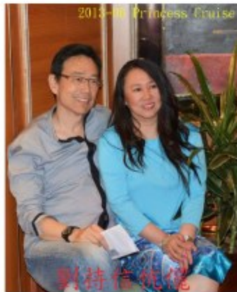
2013-06 Princess Cruise