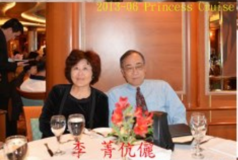
2013-06 Princess Cruise