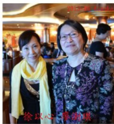
2013-06 Princess Cruise