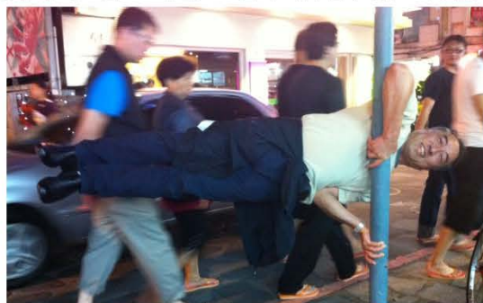
孫文驄在台北街頭的鋼管秀