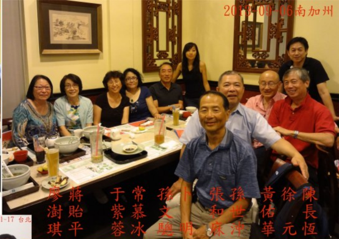
廖蔣于常孫卜張孫黃徐陳 澍貽紫慕文和世佑佑長 琪平蓉冰駒明麻沖華元恆